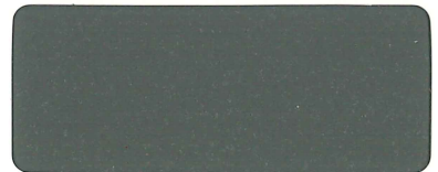
Yグレー弾性骨材入り