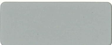
遮熱ライトグレー