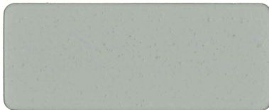
ライトグレー弾性骨材入り