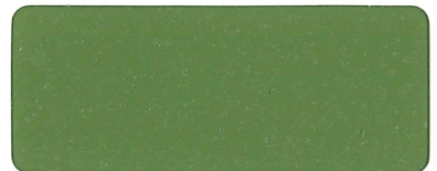
ライトグリーン弾性骨材入り★