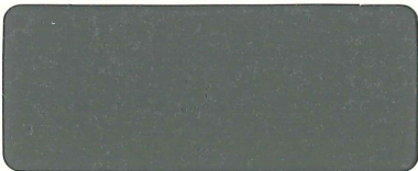
グレー弾性骨材入り