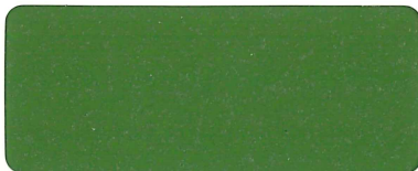
グリーン弾性骨材入り★