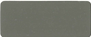
ノースブラウン弾性骨材入り